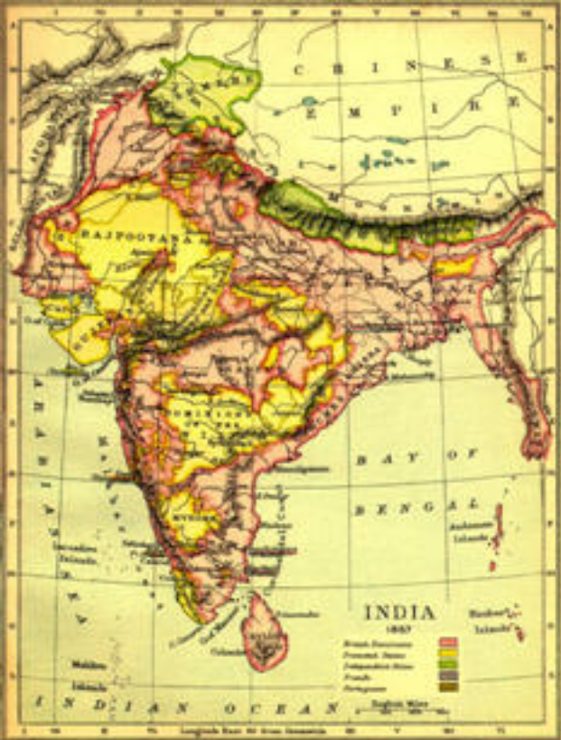
แผนที่อินเดียเมื่อปี พ.ศ. ๒๔๐๐ แสดงถึงอิทธิพลของอังกฤษในอินเดีย และ หมายล่งล้ำเข้าพม่า จนเป็นเหตุให้พม่าสูญเสียเอกราชในเวลาต่อมา

อินโดนีเซียได้พยายามแยกตัวจากคนพื้นเมืองโดยถือว่าเป็นคนละชนชั้นกัน ไม่สนใจที่จะยกระดับฐานะทางสังคม การศึกษาและความเป็นอยู่ของคนพื้นเมือง เพราะถือว่าจะทำให้ปกครองยาก จำกัดการศึกษาเฉพาะคนยุโรป ชาวดัตช์ และชาวอินโดนีเซียชั้นสูงเท่านั้น นอกจากนี้ชาวดัตช์ยังส่งพวกมิชชันนารีเข้าไปโดยกีดกันพวกมุสลิม ไม่ให้ความคุ้มครองสิทธิและไม่ดำรงรักษาขนบธรรมเนียมของอินโดนีเซียไว้