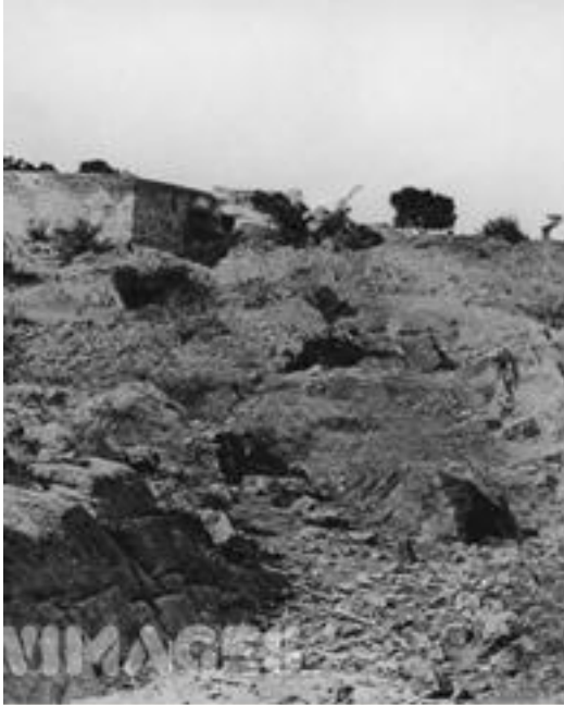
กองกระดูกของทหารอินเดียในกองทัพอังกฤษ ที่สังกัดบริษัทอีสต์อินเดียใกล้กรุงเดลี ซึ่งถูกสังหาร โดยกองทัพของอังกฤษเอง เนื่องจากกบฏก่อในปี พ.ศ. ๒๔๐๐

๓. ความต้องการเผยแพร่อุดมการณ์ทางศาสนาและการเมือง โดยเชื่อมั่นว่า ระบบการเมืองเศรษฐกิจและสังคมของตะวันตกเป็นหลักการที่ดี จึงถือเอาเป็นเหตุว่าเมือง จึงส่งผู้แทนหรือมิชชันนารีเข้ามาทำการเผยแพร่ศาสนาหรืออุดมการณ์ทางการเมืองในภูมิภาคนี้