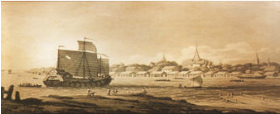
ประเทศไทย

ทางที่จะกันการเสียประโยชน์แลลำบากมีพอที่จะเป็นดังกล่าวแล้วนี้ ก็ควรที่เจ้าพนักงานจะเก็บเงินตรานั้นไว้ใน ท้องพระคลังหลวง แล้วออกไปสำคัญจำหน่ายให้ราษฎรไปใช้ต่างเงินตรา เมื่อจะต้องการเงินตราขณะใดก็ให้มารับได้สมปรารถนา...&rdquo; โดยให้ &ldquo; กรมเก็บกระทรวงพระคลังมหาสมบัติ &rdquo; มีหน้าที่รักษาเงินตราไว้ให้มั่นคง เพื่อการจำหน่าย การรับขึ้น ตลอดจนการรับอายุต์เงินกระดาษหลวงนั้นให้แก่ราษฎร ทั้งนี้มีกำหนดออกใช้ในวันที่ ๑ เมษายน ร.ศ. ๑๑๒ (พ.ศ. ๒๔๓๖) อย่างไรก็ตาม แม้จะพิมพ์เงินกระดาษหลวงแล้วและเสียค่าใช้จ่ายในการจัดพิมพ์ไปไม่น้อย