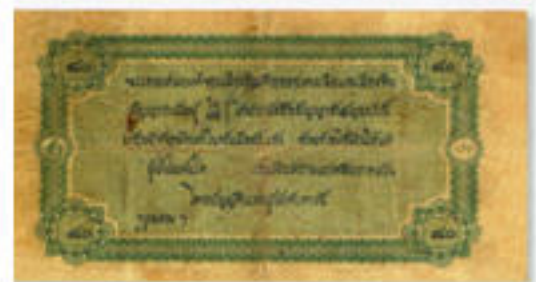
ธนาคารชาเตอร์แห่งอินเดีย ออสเตรเลียและจีน