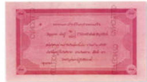
บัตรธนาคาร ชนิดราคา ๕๐๐ บาท ของธนาคารฮ่องกงและเซี่ยงไฮ้