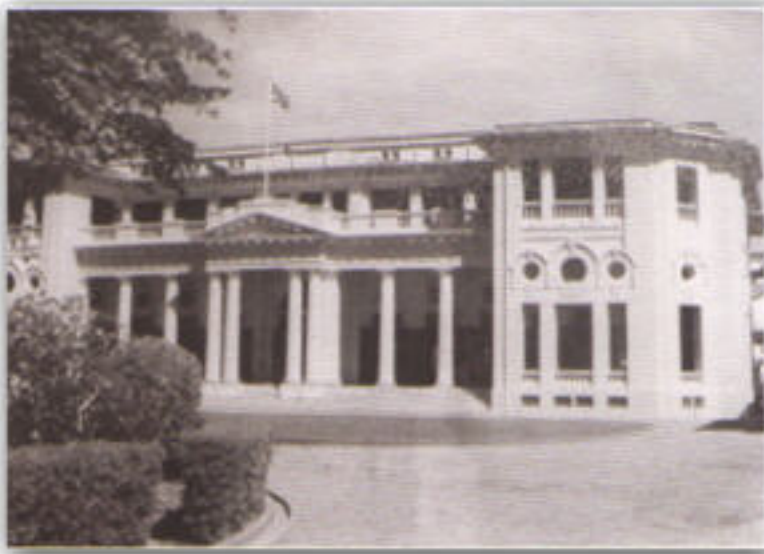
ธนาคารฮ่องกงและเซี่ยงไฮ้ (เปิดสาขาในประเทศไทยเมื่อ พ.ศ. ๒๔๓๑)

ตั้งแต่ปี พ.ศ. ๒๔๓๑ เป็นต้นมา สืบเนื่องจากการที่พระบาทสมเด็จพระจุลจอมเกล้าเจ้าอยู่หัวทรงปฏิรูประบบการเงินและการคลัง และเมื่อการค้าขายกับต่างประเทศได้เจริญขึ้นอย่างรวดเร็ว ทำให้ความต้องการเงินตราเพื่อซื้อขายภายในประเทศเพิ่มขึ้นมากจนเกินความสามารถที่จะผลิตเหรียญเงินบาทที่ใช้กันในช่วงเวลานั้นให้ทันกับความต้องการ บรรดาพ่อค้าชาวต่างประเทศที่ต้องการซื้อสินค้าไทยต่างไม่ได้รับความสะดวกที่ต้องนำเรือมาทอดสมอและต้องรอรับสินค้าไทยเป็นเวลานานจึงพากันไปร้องเรียนต่อสถานกงสุลของตน เพื่อเป็นการแก้ปัญหาดังกล่าวรัฐบาลจึงได้จัดเตรียมออกตัวเงินของพระคลังมหาสมบัติ ที่เรียกกันว่า &ldquo;เงินกระดาษหลวง&rdquo;