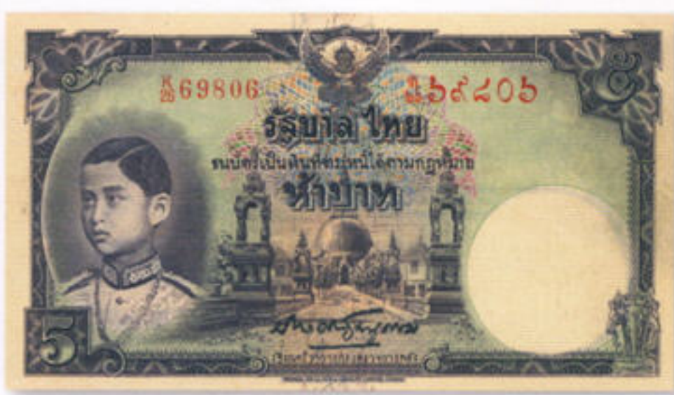
ตัวอย่าง ธาบัตรแบบ ๔ รุ่น ๒ ประกาศออกใช้ ๗ มีนาคม ๒๔๘๒

สำหรับแนวคิดในการจัดตั้ง &quot;ธนาคารกลาง&quot; ของพระเจ้าบรมวงศ์เธอ กรมหมื่นมหิศรราชหฤทัย ที่ถูกระงับไปก่อนเนื่องจากที่ปรึกษาการคลังชาวอังกฤษไม่เห็นด้วยและไม่ให้การสนับสนุน แต่ด้วยตระหนักถึงความยากลำบากของคนไทย